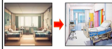
大部屋から個室への変更【差額ベッド代】

選定療養とは・・・特別な療養環境など自ら希望して選ぶ療養で保険導入を前提としない療養です。